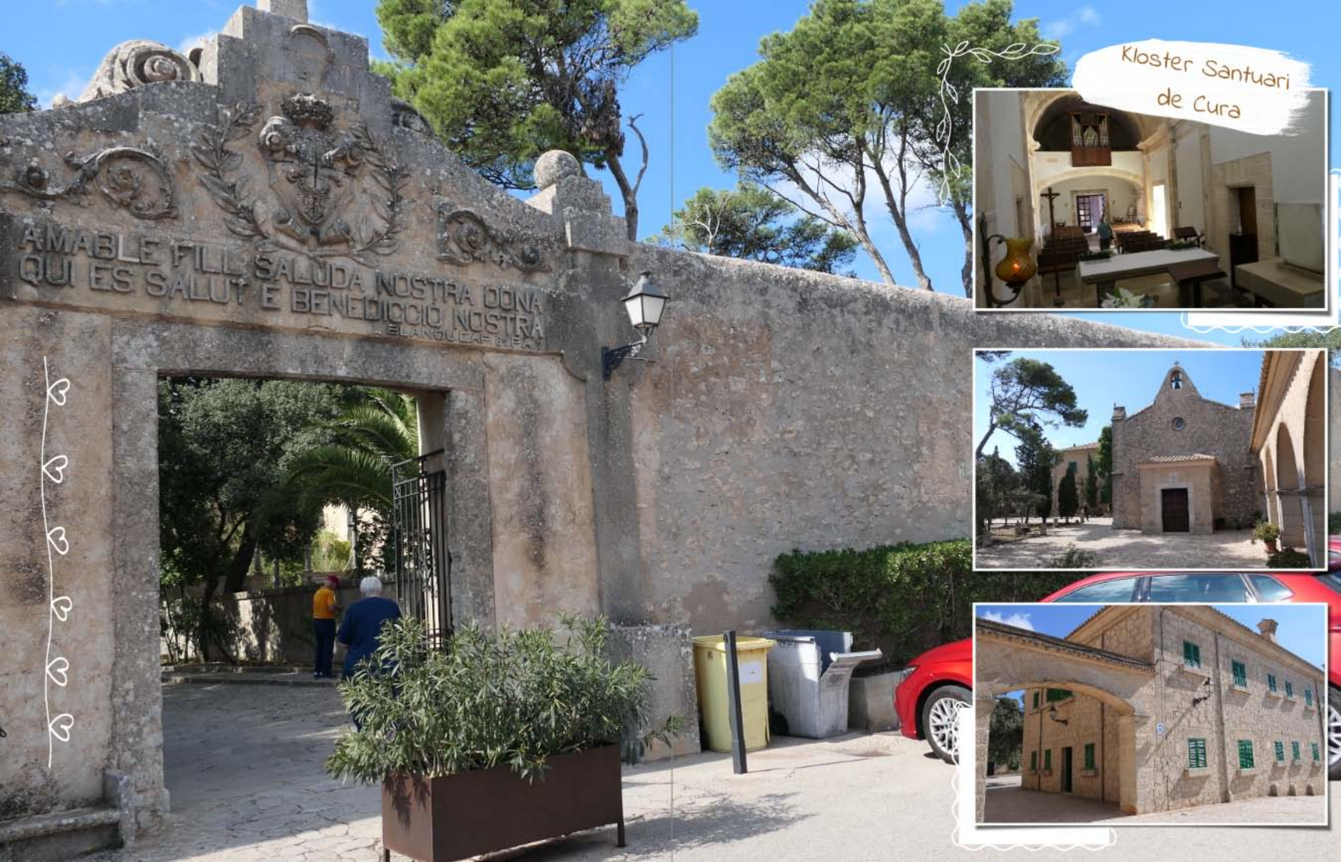
Kloster Santuari de Cura