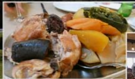
Cozido das Furnas (Tonys Restaurant)