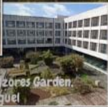
Hotel Azores Garden Sao Miguel