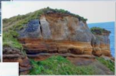
Roque de San Pedro