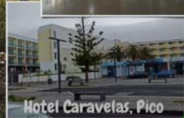
Hotel Caravelas, Pico