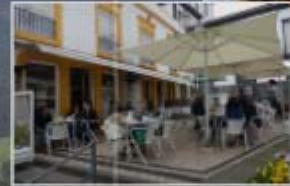
Cafe Central Sao Miguel