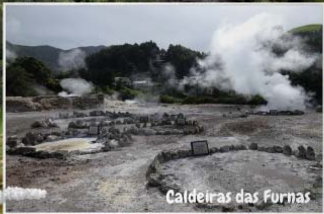
Caldeiras das Furnas