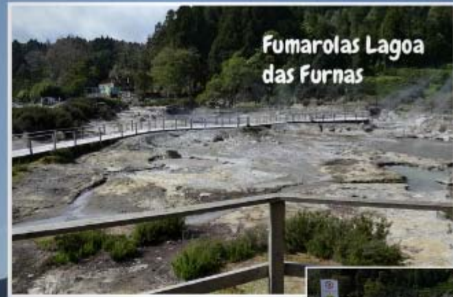
Fumarolas Lagoa das Furnas