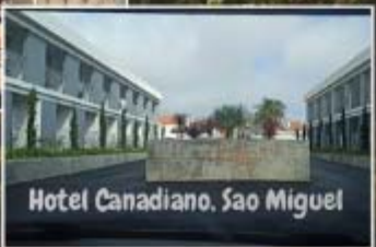
Hotel Canadiano, Sao Miguel